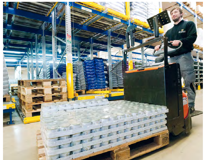
Für den horizontalen Transport der Paletten und das Be- und Entladen der Lkw kommen insgesamt acht Elektro-Niederhubwagen der Baureihe BT Levio zum Einsatz.

Bei Vet-Concept wird zum Teil direkt aus dem Regal gepickt – dabei handelt es sich vorwiegend um kleinere Kauartikeln. Mit einer